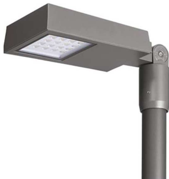
OMS Stelaris 27W ,3362lm

Svietidlá sú napojené celoplastovými medenými káblami CYKY 3Jx1,5 z poistkovej skrinky osadenej v stožiare, na každom stožiare bude svietidlo vo výške cca 4m. Každý stĺp verejného osvetlenia je pripojený na zemniaci pás príslušnou spojkou. Spoje v zemi inštalovať dvomi svorkami SR02 a spoje opatrit' protikoróznym náterom.